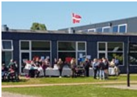
8 classes kaffebo