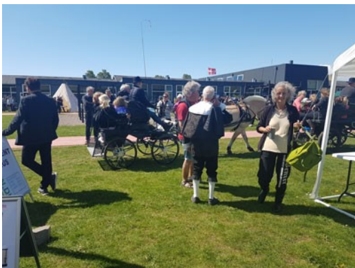
Kørsel med hestevogn dagen lang.