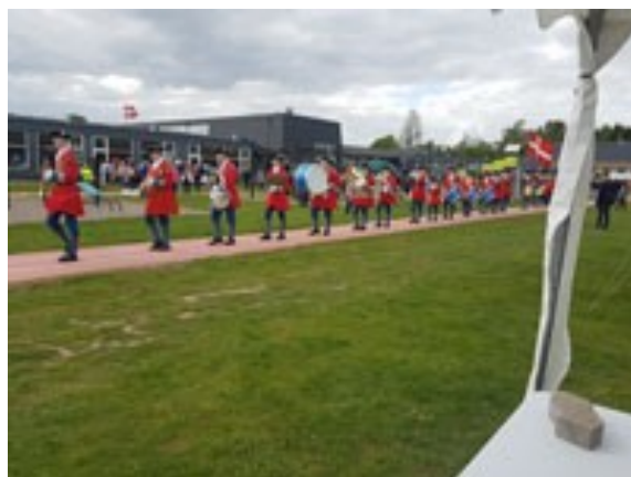
Prins Jørgens Garde fra Vordingborg afsluttede