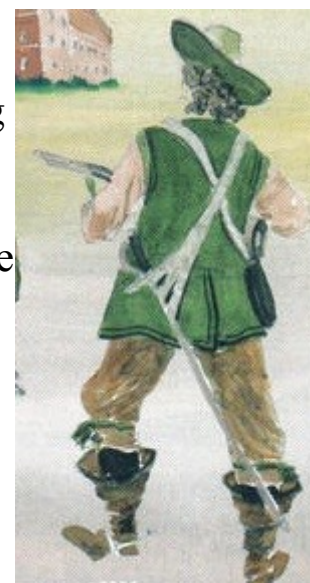
En ung vildbasse...