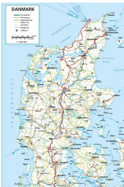
Hærvejen indtegnet på nutidigt kort.

30 årskrigen var forfærdelig for almindelige mennesker overalt, hvor den udspillede sig. De værst ramt områder i Tyskland var omtrent 100 år om at komme på fode igen efter krigens hærgen. Jylland blev også hårdt ramt af krige i 1600-tallet. Som udløber af 30 årskrigen besatte en katolsk hær under ledelse af Wallenstein hele Jylland i efteråret 1627. 30.000 soldater var i hæren. Dertil kommer flere tusinde flygtende danske soldater og de var somme tider værre end soldaterne i den kejserlige hær. Der er eksempler på, at de danske soldater var så forhadte, at den lokale befolkning gav de kejserlige soldater underretning om deres bevægelser og opholdssteder.