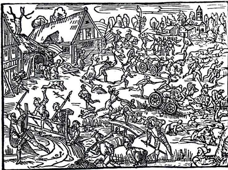
Fig. 9. Plyndring af en landsby. Man ser de harniskklædte knægte nådeløst trække byens beboere ud af husene, hugge dem ned og bortføre kvæget og vogne lastede med gods. Træsnit fra »Chronicon Oldenburgensis«, 1599.