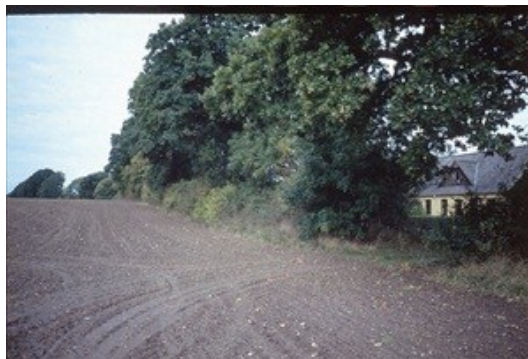
Vildtbanevolden på bagsiden af Vildtbanegården, Smidstrup.

Overgangen blev kaldt Kongeporten. Det var jo nærliggende, da vejen, som førte over vildtbanegrøften, var Kongevejen, der gik fra Vordingborg til København. Her ved Gl. Tappernøje Kro, startede Christian d. Fjerdes vildtbane i 1617, og forløbet var de 15 km. tværs over Sydsjælland til Dybsø Fjord. Det samlede vildtbaneareal blev på ca. 400 kvadratkilometer og var Nordens største dyrehave.