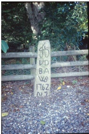
Vildtbanesten nr. 7 i Tågeby, uden kongekrone.

Her er alt væk. Der er kun volden, som kommer fra nordøst fra St. Røttinge. Indtil Reformationen 1536 bestod Skovbygaard af 15 gårde og hørte til Risby Sogn. Senere i tiden talte man om Store og Lille Skovbygaard, på hvis jorder Engelholm blev bygget i 1700-tallet.