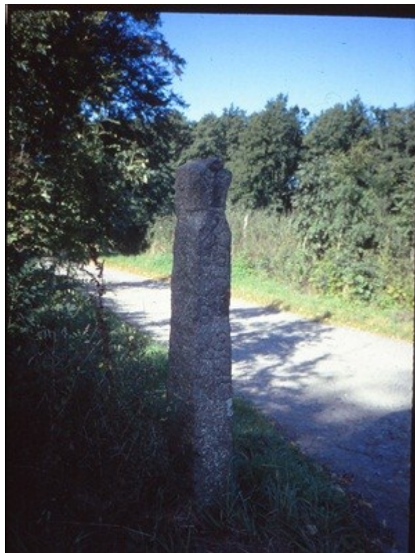
Vildtbanesten nr. 12 ved Oremandsgård.

Valdemar Atterdag (1340-1375) anlagde en vildtbane i Vintersbølle Skov øst for Vordingborg. Vildtbanen skulle bruges til vildsvinejagt, som var meget brugt