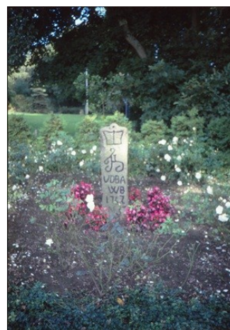
Vildtbanesten nr. 6 står i haven på gården Tvingbro, Ronas Banke.