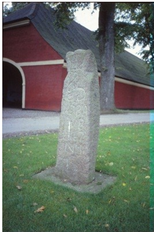
Vildtbanesten nr. 1 på Chr. IVs Vildtbane i indkørslen til Nysø ods, Præstø.

Vildtbanen blev oprettet i 1746 og blev afgrænset med ca. 16 vildtbanepæle, hugget i granit. Uden for Vildtbanen var nu Jungshoved Sogn, Skibinge Sogn, Allerslev sogn og en del af Mern sogn samt Præstø og Nysø.